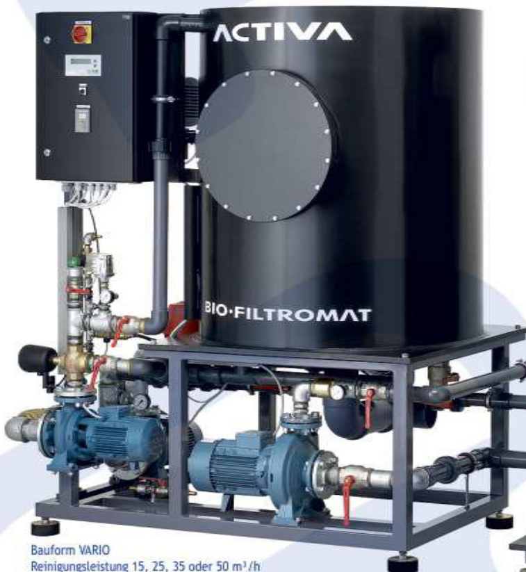
Bauform VARIO Reinigungsleistung 15, 25, 35 oder 50 m 3 /h