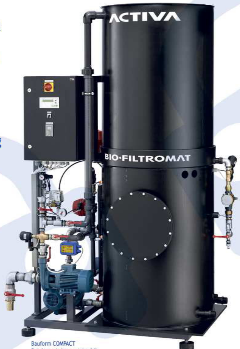
Bauform COMPACT Reinigungsleistung 4-6 m 3 /h